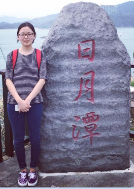
照片说明:与学校组织的户外之旅 -日月潭环湖一日游

学习到的。我觉得台湾的教育很重视感恩、礼貌，教育的范围很广很细，很注意学生到卫生。我深深意识到教育是国家发展的根本，孩子是祖国的未来，台湾的教育确实很好，所以全民素质高，难怪一句中国的文化在台湾。