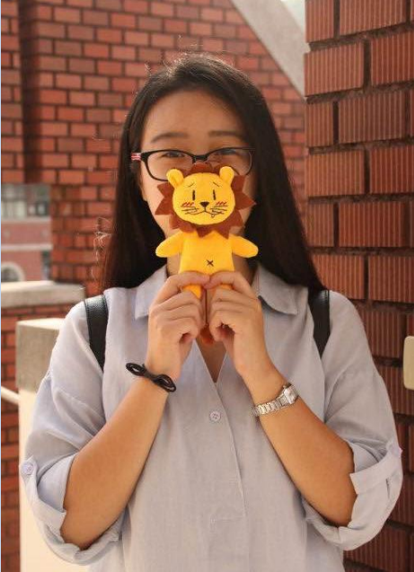
摄于大叶大学行政大楼

母校:湖洲师范学院·生物科学类专业。 就读大叶大学·生物科技暨资源学院 生物产业科技学系。