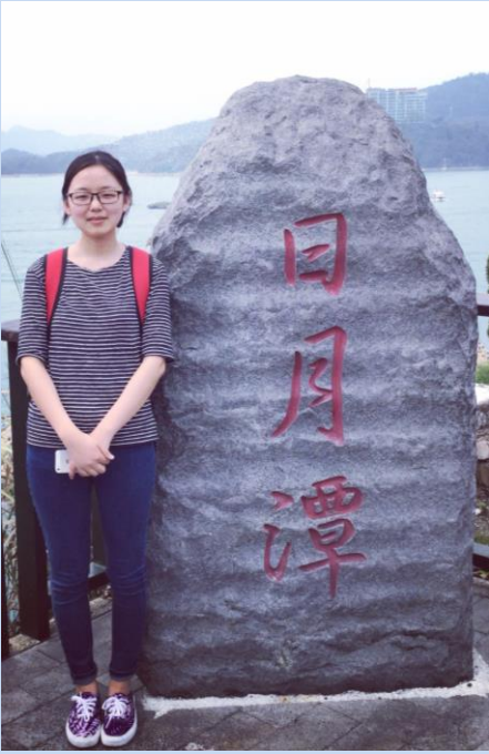
与学校组织的户外之旅-日月潭环湖一日游

到的。我觉得台湾的教育很重视感恩、礼貌，教育的范围很广很细，很注意学生到卫生。我深深意识到教育是国家发展的根本，孩子是祖国的未来，台湾的教育确实很好，所以全民素质高，难怪一句中国的文化在台湾。